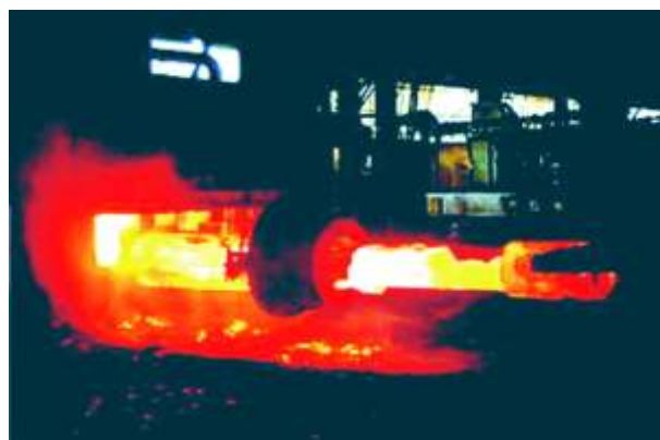
Linha de Produção