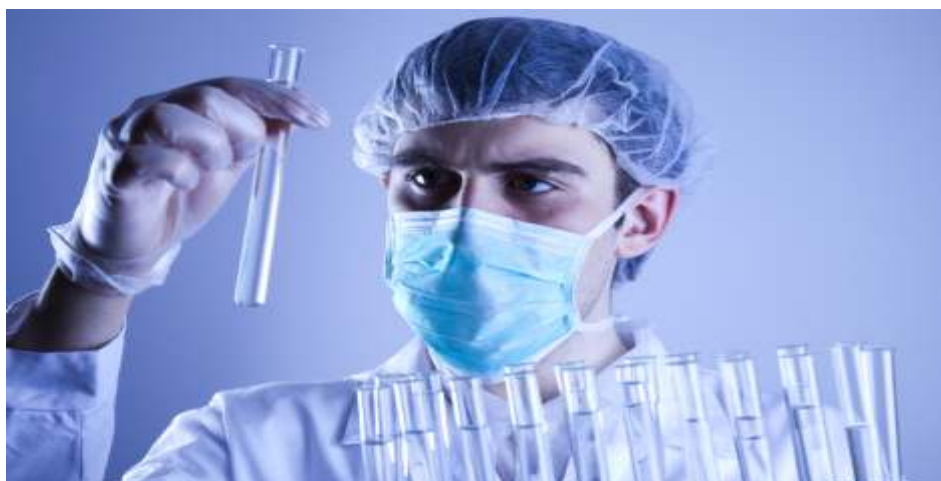
Análise Química Laboratorial